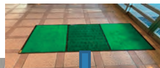
玄関には靴底の消毒マットを置き濃いグリーン部分を踏むことにより外部からの入ってくる靴底を除菌。感染症を予防しています。

顧客・従業員共に「期待を超える感動を」与えられる会社へと成長していきたいと考えています。アクサ生命のアドバイスを参考に健康経営に取り組み、より働きやすい、社員が自信をもって仕事ができる環境づくりに励んでいます。そのことが従業員満足度UPとなり個客満足度UPに繋がり、会社の存在意義UPに繋がっていくと考えています。